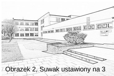
Obrazek 2, Suwak ustawiony na 3

Aby zacząć przerabiać obrazek na rysunek, musimy wejść na podaną stronę www.pencilsketch.imageonline.co . Następnie musimy załadować zdjęcie. Pod zdjęciem będzie można zobaczyć suwak, dzięki niemu będziemy mogli ustawić to, jak bardzo dokładny ma być nasz szkic. Przykład można zobaczyć poniżej: