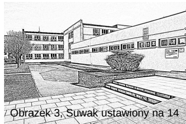
Obrazek 3, Suwak ustawiony na 14

Następnie klikamy niebieski przycisk z napisem pencil sketch, a potem przycisk download. Zapraszam do przetestowania narzędzia!